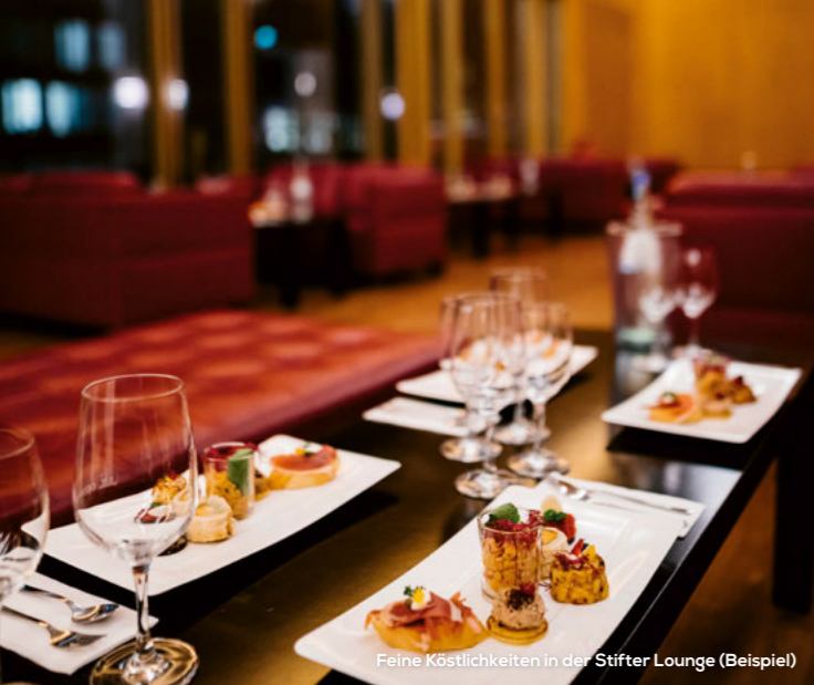
Feine Köstlichkeiten in der Stifter Lounge (Beispiel)

Service, Beratung und Buchung Further Information and Reservations Telefon +49 (40) 35 68 222 Fax +49 (40) 35 68 610 gruppen@staatsoper-hamburg.de groups@staatsoper-hamburg.de